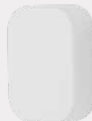
/ SONDA EXTERNA