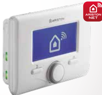
/ SENSYS NET